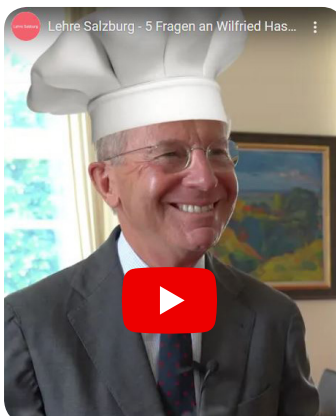
„Kann man mit einer Lehre Landeshauptmann werden?“ 5 Fragen an Wilfried Haslauer Landeshauptmann